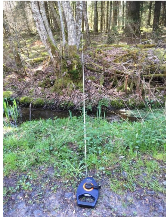
Figure 4 : Exemple de transect forestier pour la réalisation de relevés de physiognomie de la végétation dans les tourbières du PNR du Morvan Crédit : S. Piñeros, 18 avril 2019

L'ascension à pieds de l'éperon rocheux de la Roche de Solutré a été l'occasion d'approfondir les thématiques rurales, agricoles et viticoles, en ré-abordant les notions de terroirs, finages, et de climats (au sens viticole). Après quelques explications géomorphologiques de cette formation, héritage du Jurassique moyen, et d'une discussion sur les temps géologiques (abordée en Climats Terrestres l'année précédente), les étudiant.e.s ont pu profiter de ce point de vue sous le soleil, et réaliser des croquis paysagers. Ceux-ci ont été opérés à 360°, chaque groupe d'étudiant.e.s étant dispatché autour du sommet (figures 5 et 6).