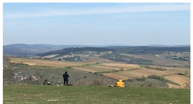
Figure 6 : Étudiants en train de réaliser un croquis paysager sur la face NE de la Roche de Solutré.