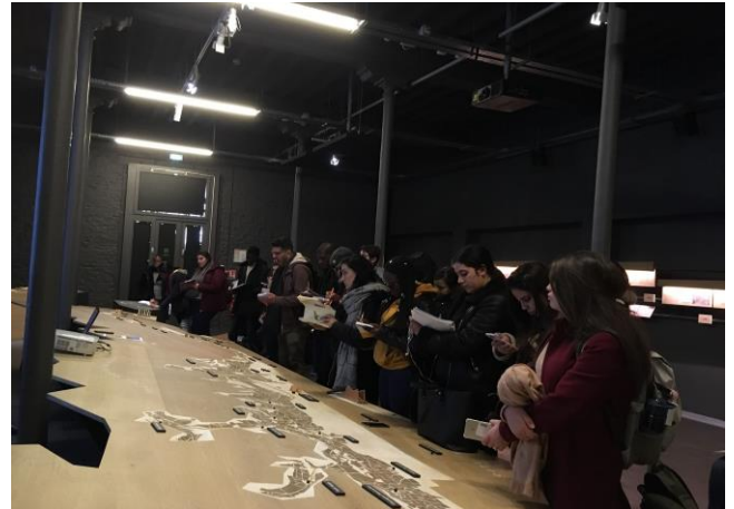
Figure 2 : Etudiant.e.s découvrant la maquette cartographique, en réalité augmentée, des climats le long des vignobles AOC (Crédits : S. Piñeros, 15/04/2019)

Les paysages « naturels », et sylvicoles/agricoles, ont été approchés après avoir parcourus les bocages et forêts morvandiaux en bus. La visite du Syndicat Mixte du Parc Naturel Régional du Morvan et la réalisation de relevés floristiques ont été appuyés par les chargés de mission Patrimoine et animateurs Natura 2000. Pour cette partie « paysages naturels », des parcelles