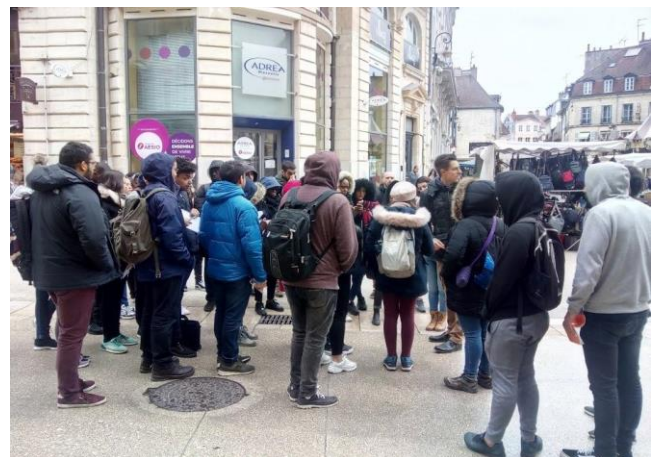
Figure 3 : Etudiant.e.s et accompagnateur.e.s bravant les éléments en milieu urbain (Crédits : R. Courault, 16 avril 2019)