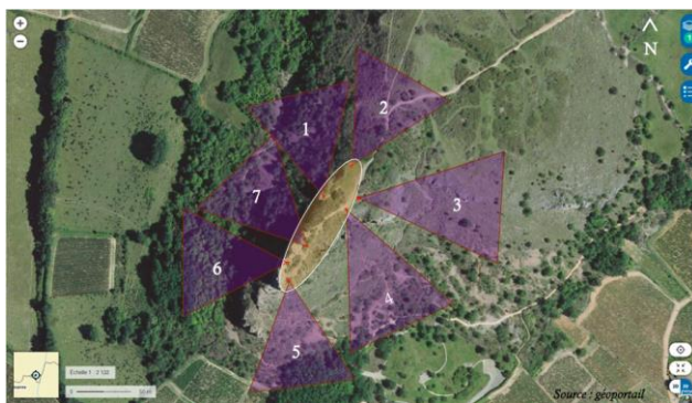
Figure 5 : Emplacement de groupes d'étudiants pour l'élaboration de croquis paysagers sur la Roche de Solutré.

Les croquis paysagers ont amené les étudiant.e.s à tenter de sectoriser graphiquement la portion d'espace qu'ils percevaient (premier plan, deuxième, arrière-plan notamment), à hiérarchiser les éléments paysagers, et à les nommer/catégoriser (voir annexe 4).