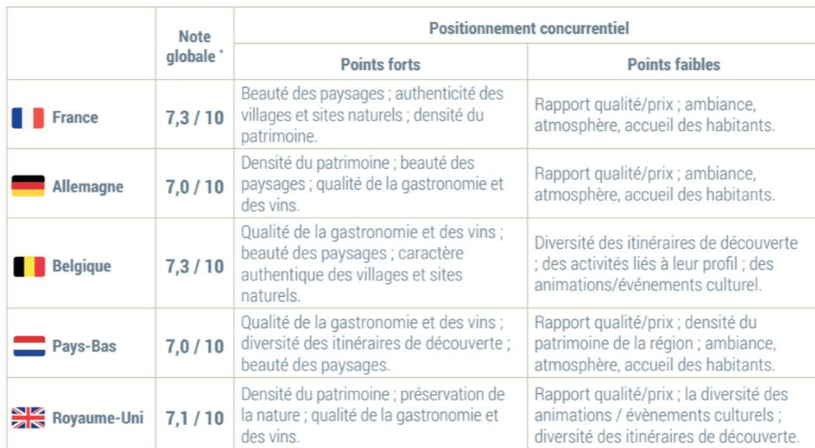
Tableau 1 : « Positionnement concurrentiel » de la Région Bourgogne Franche-Comté. Disponible sur : http://nievre.tourisme-bourgogne.pro/sites/default/files/bourgogne/chiffrescles-bourgogne-ok-1467904183.pdf

Le tableau 1 et la Figure 1 (Annexe 1) représentent les questionnements initiaux de la démarche de terrain, discutés conjointement avec les étudiant.e.s. Le tableau 1 provient de l'Édition 2016 « Bourgogne, les chiffres clés du tourisme » édité par le Comité Régional du Tourisme de la région Bourgogne Franche-Comté. La figure 1 est issue d'une impression d'écran faite lors d'une recherche sur Google Image, en tapant les mots-clés « Burgundy landscape ». En effet, les imaginaires, en particulier les hauts-lieux du tourisme et leur représentation picturale sont de plus en plus nourris par les réseaux sociaux et applications liées aux activités touristiques ( TripAdvisor, Yelp, etc. ). Google Images présente l'intérêt de centraliser l'ensemble des photographies et images prises et rattachées à certains mots-clés, référençant en une page web une partie importante des images et imaginaires rattachés aux paysages bourguignons. L'anglais a été utilisé dans la recherche par mots-clés, étant donné l'importance du tourisme international dans la région (européen, ou extra-européen), et le désir d'attraction des flux touristiques étrangers par la région.